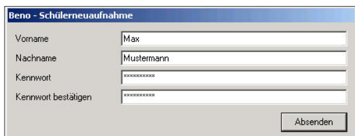
Abbildung: Eingabemaske für manuelle Neuaufnahme

Nutzer (Lehrer oder Schüler), die zu einem späteren Zeitpunkt an die Einrichtung kommen, nehmen Sie über ein Dialogfenster in die Benutzerverwaltung auf. Die Erzeugung des jeweiligen Homeverzeichnisses, der Zugriffsrechte und der E-Mail-Adresse erfolgt auch hier automatisch durch das System.