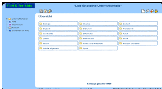
Abbildung: Webkatalog mit Unterrichtsinhalten

Die Weiterentwicklung und Pflege erfolgt durch einen gemeinnützigen Träger.